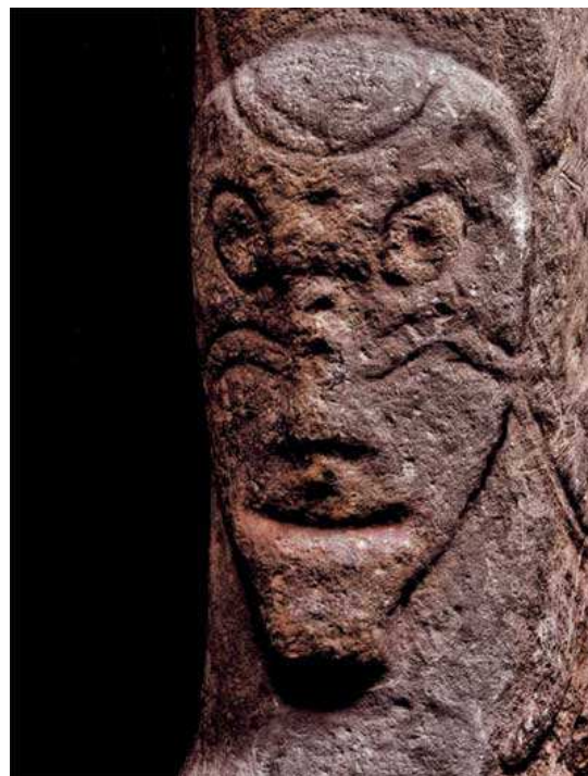
Stèles en forme de tête (culture Okuniev - Sibérie)