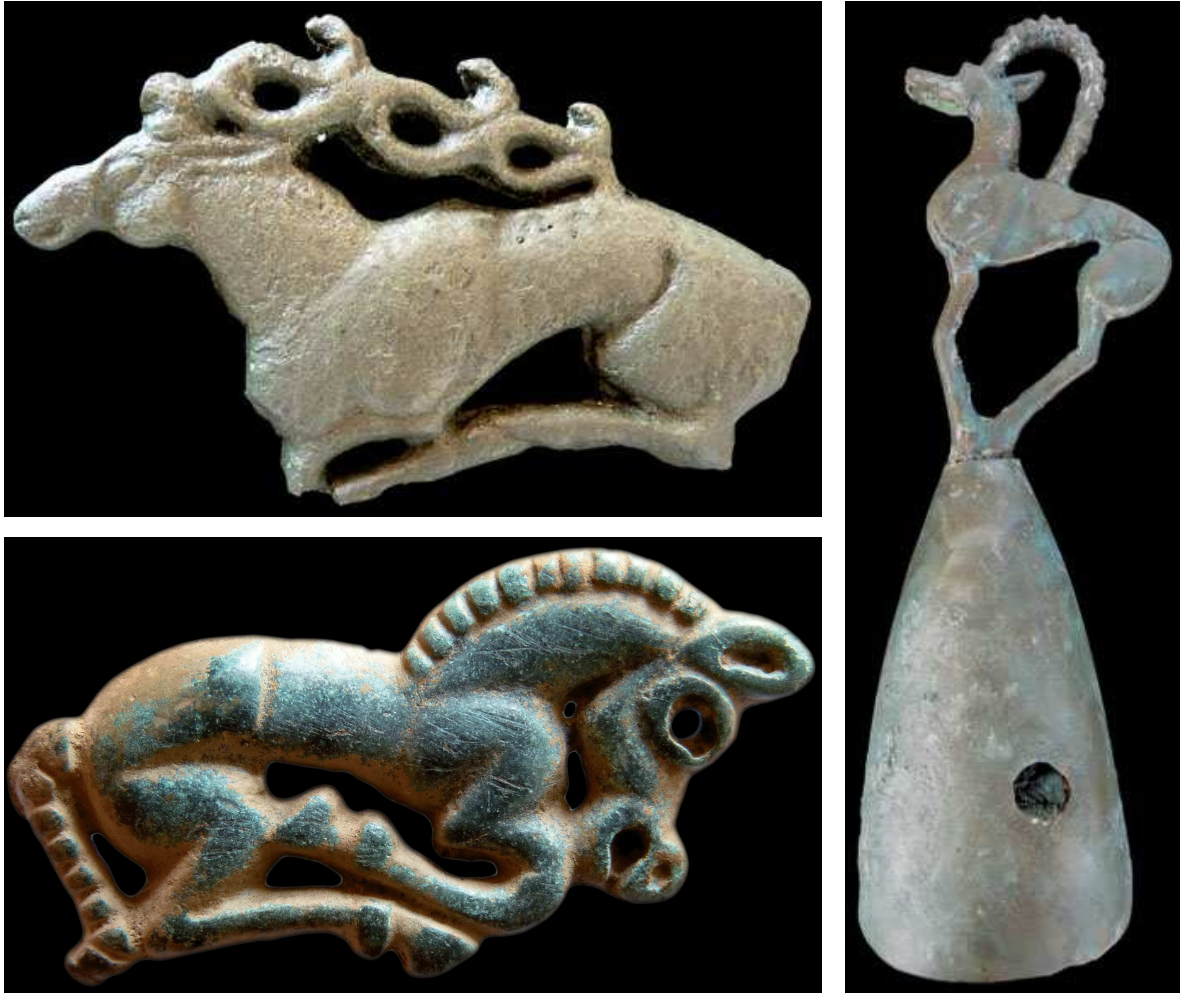
Moulages d'appliques en bronze représentant un cerf (culture Tagar - Sibérie) et un cheval (Tsatsyn Ereg - Mongolie) Moulage d'un surmont (culture Tagar - Sibérie)

Outre les objets exposés en vitrine, l'exposition Premiers nomades de Haute-Asie , propose un volet consacré à une découverte archéologique majeure, celle de la nécropole d'Arjan. Menée entre 2000 et 2003 par une équipe russe et allemande, la mission a découvert une tombe princière intacte avec plus de 9 300 objets dont la moitié en or.