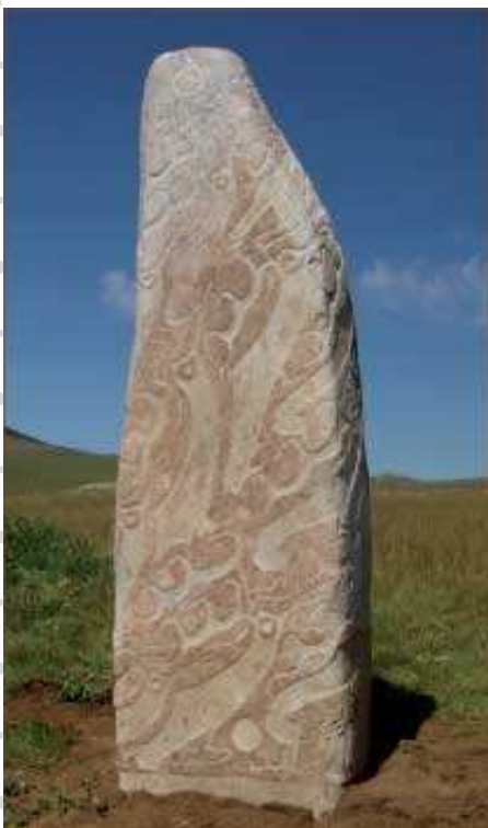
Pierre à cerfs et gravures sur roches (Tsatsyn Ereg - Mongolie)