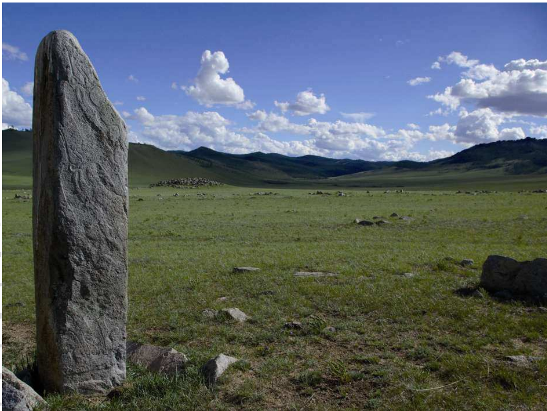
© Jérôme Magail, directeur de la mission archéologique Site de Tsatsyn Ereg (Mongolie)

Situé à 500 km à l'ouest de Oulan-Bator, capitale de la Mongolie, Tsatsyn Ereg est un site archéologique majeur. Près de 500 tombes, 62 grandes stèles ornées et des milliers des dessins gravés sur des rochers datant de 1 000 ans avant JC, ont été mis au jour par la mission archéologique conjointe Monaco-Mongolie. Aujourd'hui, sur près de 140 monuments dénombrés, 62 ont été répertoriés et relevés. Les 3 000 ans de mode de vie nomade, pratiqué sans interruption depuis l'Age du Bronze, ont contribué à la sauvegarde de ce patrimoine. En effet, les éleveurs qui se déplacent avec leurs yourtes et leurs troupeaux n'utilisent jamais de pierres et ne détruisent donc pas les constructions anciennes. Les animaux gravés sur les monolithes sont associés à des figurations d'armes et des gravures rupestres disséminées sur toute la Haute-Asie.