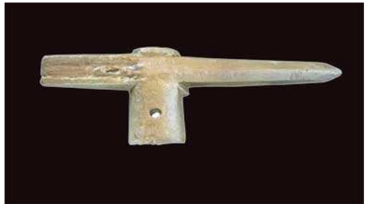
Moulages d'un poignard en bronze et d'une hache pic en bronze (musée national des Recherches régionales de Khakassie (Sibérie))