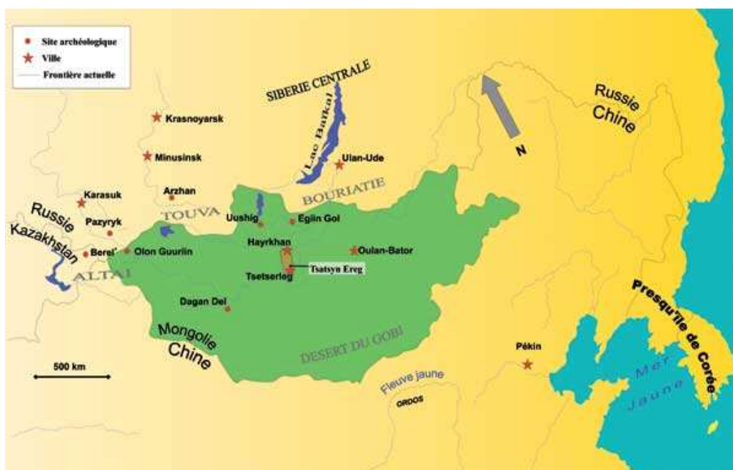
Carte de Haute-Asie

Aux confins orientaux de la grande steppe, le territoire mongol semble avoir joué un rôle clé dans la naissance des civilisations nomades du tout début du I er millénaire avant notre ère. Ces civilisations sont tellement puissantes qu'aux IV e siècle avant JC, les provinces chinoises, pour se protéger de ces hordes de cavaliers, érigent les premiers pans de ce qui deviendra la Grande muraille de Chine. Les plus connus sont les Scythes mais bien avant se sont succédé les cultures Afanassiev, Okuniev, ou encore Tagar. Les Scythes sont présents jusque dans l'Altaï aux frontières du plateau mongol où débute une civilisation particulière qui se distingue notamment à travers ses monuments gravés appelés « pierres à cerfs ». Ce style iconographique est bien connu, sur les appliques métalliques trouvées dans le bassin de Minusinsk (Sibérie) et bien plus loin vers l'ouest sur les boucliers et les coiffes des Scythes d'Ukraine au VII e siècle avant notre ère. Les indices de parenté culturelle avec les Scythes ne se limitent pas au bestiaire, ils s'étendent au répertoire des armes gravées sur les menhirs de granite. Boucliers, poignards, couteaux, haches et arcs figurent parmi les représentations les plus rencontrées. Les archéologues ont donc cherché les objets correspondant aux dessins gravés sur les stèles afin de déterminer les influences culturelles des populations qui ont érigé ces monuments.